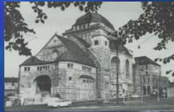
1979 Synagoge, Essen