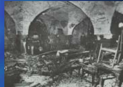
1971 Rathaus Bremen