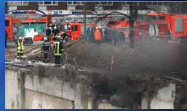
2007 Folkwang Museum, Essen