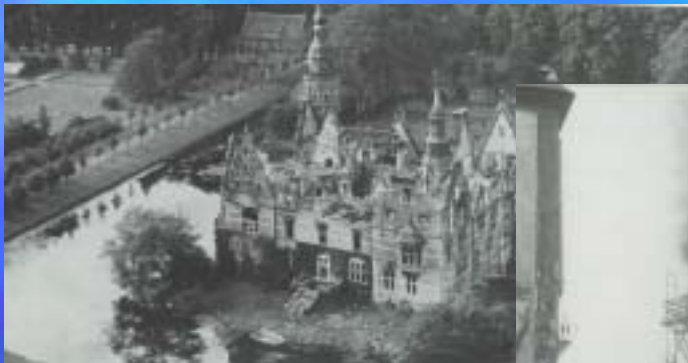
1956 Schloss Lütelsburg