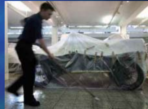
1999 Deutsches Museum