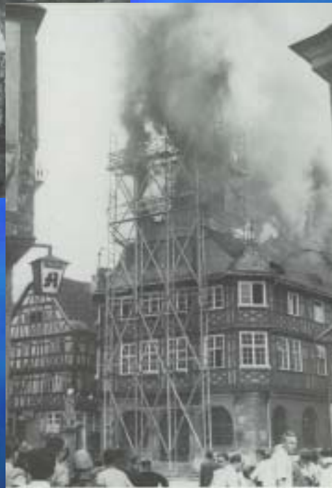
1958 Rathaus Heppenheim