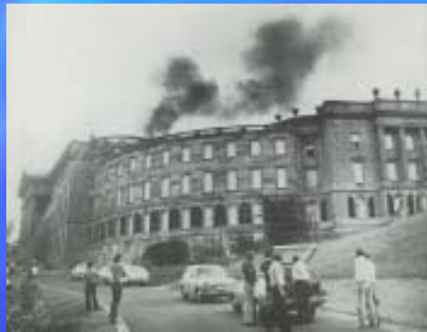
1975 Schloss Wilhelmshöhe