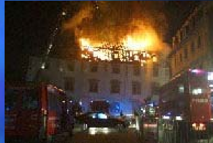
2004 Anna-Amalia-Bibliothek, Weimar