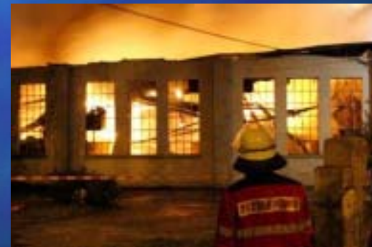
2005 Eisenbahnmuseum Nürnberg