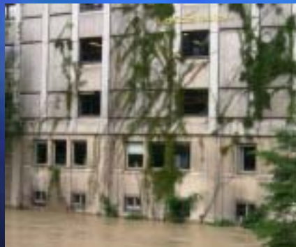
2005 Deutsches Museum