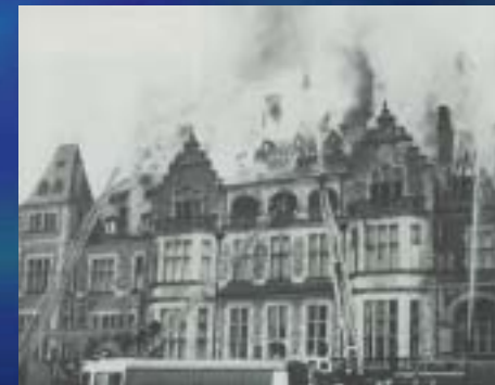
1967 Schloss Friedrichshof