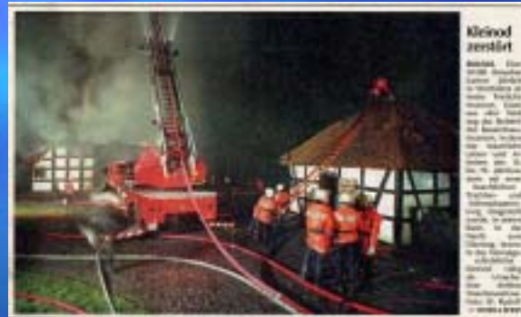
1995 Museum Bielefeld