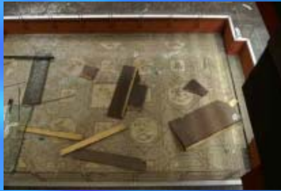
2007 RGM, Köln