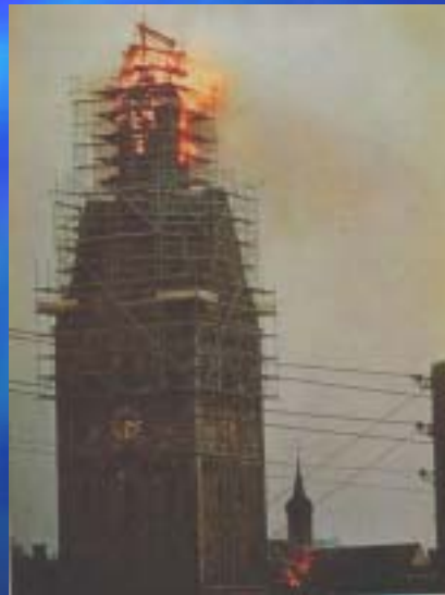
1971 Kirche Erwitte