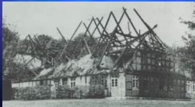
1976 Museum Rothenburg