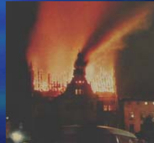
1959 Rathaus Schweinfurt