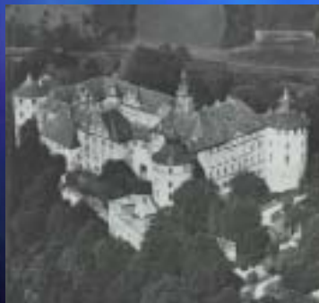
1963 Schloss Langenburg