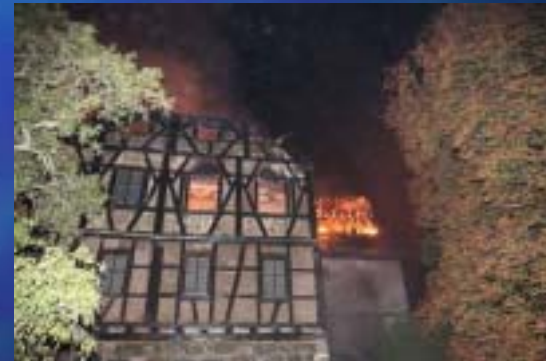
2009 Schloss, Ebelsbach