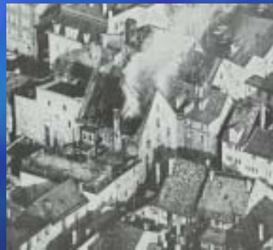
1966 Hohes Haus Konstanz