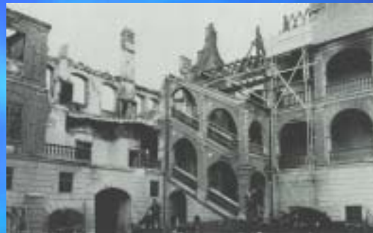
1961 Burg Traunitz