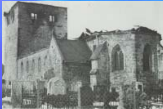
1970 Kirche Nettlingen