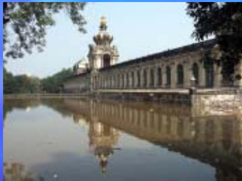
2002 Dresden und Elbtal